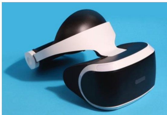
Visore per la realtà virtuale

Applicazione delle Regole generali per l'interpretazione del Sistema armonizzato 1 (nota 3 del capitolo 95), 3 b) e 6. 710108.20.2016.4